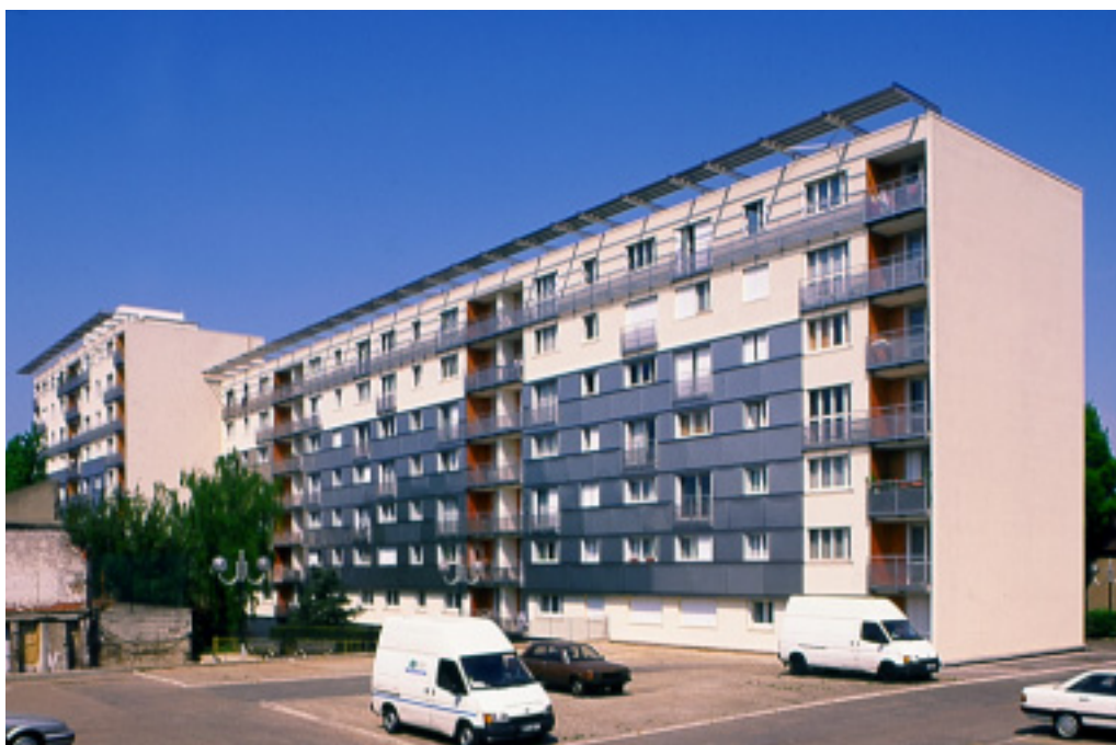
Dans le cadre d'une opération de réhabilitation légère, cet immeuble de logements sociaux a reçu une vêtue en inox sur une grande partie de ses façades.