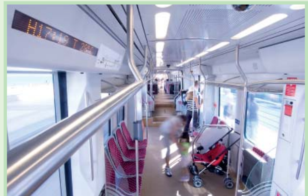
列车-电车内部

会降低。铝制轨道车辆通常用5000、6000和7000系列的铝来制造，这些牌号的铝含有一定数量的铁以保证其刚性，要将它们从一般的铝废料处理流程中分离出来，既费时又费力。如果将它们与其它铝材一起再生，再生的材料就只能用于铝铸件和类似的用途。