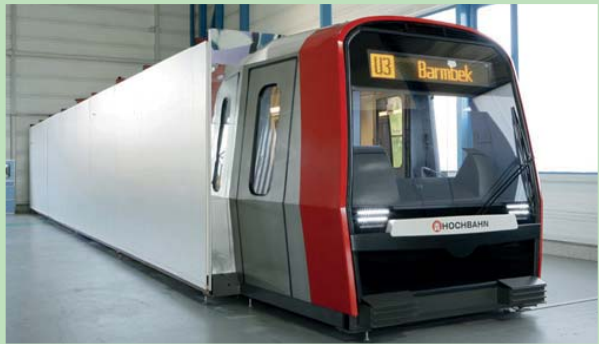
下一代汉堡地铁列车模型

列车组前部需要采用更复杂的成形作业，用铬含量和镍含量分别是18%和9%的AISI 304 (EN 1.4301) 级不锈钢制造。由于这种不锈钢有出色的成形潜力，列车前部可采用无缝设计。