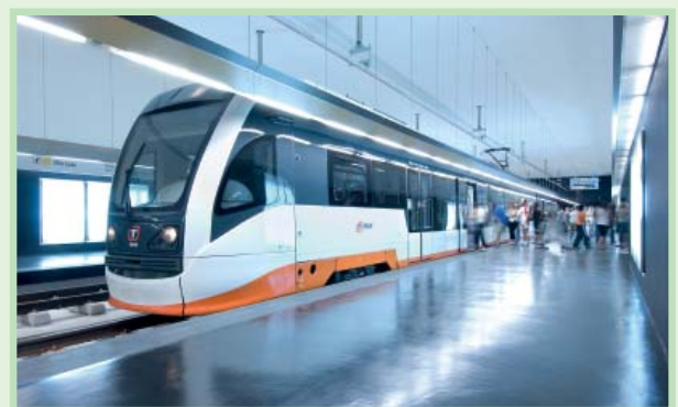
阿利坎特的列车-电车站

不锈钢降低了成本、重量和能耗。这些特性对不锈钢在铁路交通中的成功必不可少，并确保了铁路行业的可持续增长。