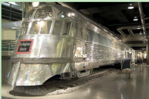
先锋者微风号列车，美国，1934年

不锈钢于1912年首次应用。1932年，第一辆全不锈钢轨道车辆由巴德公司在加拿大落基山脉投入使用。落基山脉的极端温度和运行条件使不锈钢得以充分展示其出众的技术特性和对铁路应用的独特适应性。其它铁路公司纷纷效仿，很快把不锈钢引进到他们自己的产品目录中。