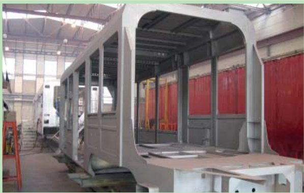
正在车间加工制造的Tango轻轨客车