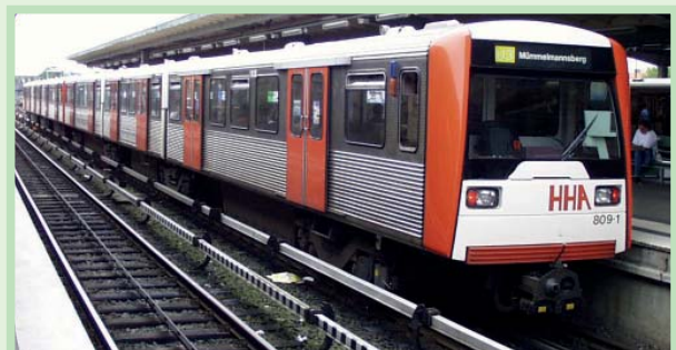
使用DT-3型列车长期积累的正面经验，确保汉堡高架铁路股份公司的下一代列车选用不锈钢。

从强度考虑，选用了加工后变硬的不锈钢等级AISI 301 LN (EN 1.4318)。尽管这种不锈钢比重不是特别低 (7.9kg/m 3 )，但是，其壁厚可以保持最小值 (1.5-2mm)，从而可确保制成的部件与它们的轻金属对应部件处于相同的重量范围。出众的抗疲劳强度使不锈钢成为城市公共交通的很好选择，因为城市交通的加速和减速时间都很短，使运行条件变得特别苛刻。