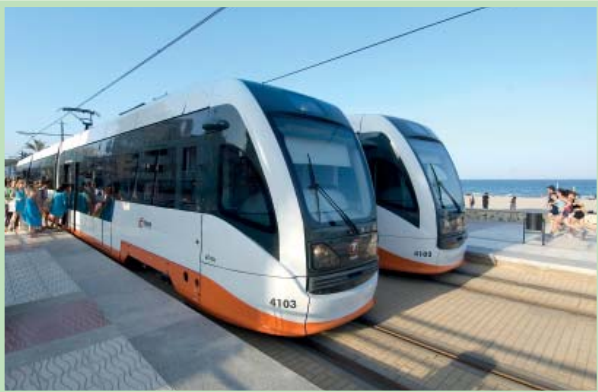
靠近阿利坎特海滩的列车-火车站