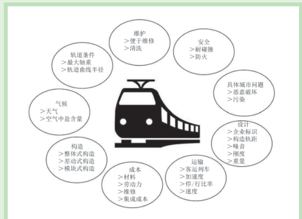
客车设计的各方面因素

今天，不锈钢广泛用于铁路领域。区域列车、市郊列车、地铁列车、轻轨列车全部依赖不锈钢解决方案。这些应用的每一项都有其自己的特点，各种机车车辆终生面对的特定运行条件决定了材料选择和设计准则。不锈钢可完美地满足这些准则中的许多准则。