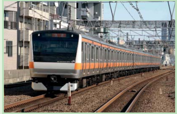
最近的不锈钢市郊列车（东日本旅客铁路公司的E233）

考虑到这些因素，东急认为，与维修和维护旧车相比，制造新轨道车辆更能有效降低寿命周期成本。东急在向铁路公司提出的建议中宣传了这种做法。公司还利用了