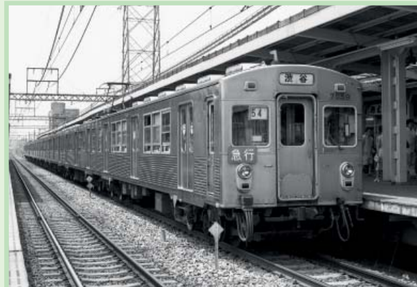
日本第一辆全不锈钢轨道车辆（东急7000-系列）