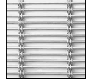
Malla para duchas