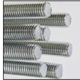
Anclajes para hormigón