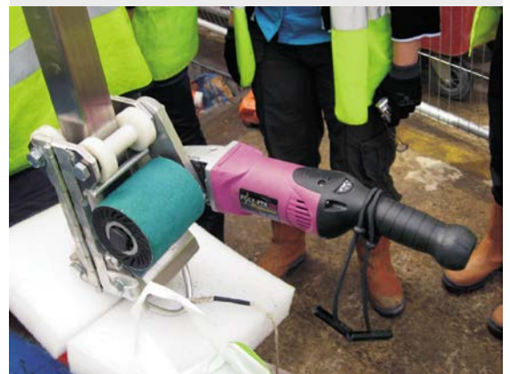
图 9: 现场抛光机(绰号“沿排水管爬上爬下的老鼠”)