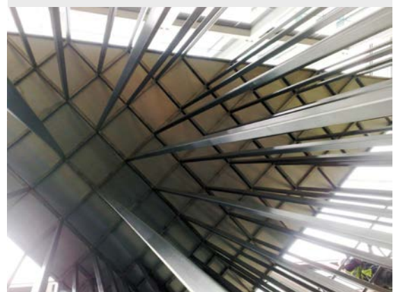
图 4: 屋顶底侧视图