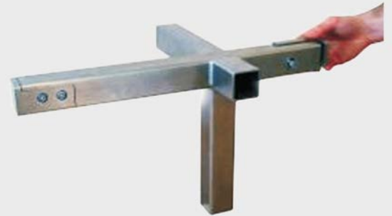
图 3: 屋顶连接部分的等尺寸模型