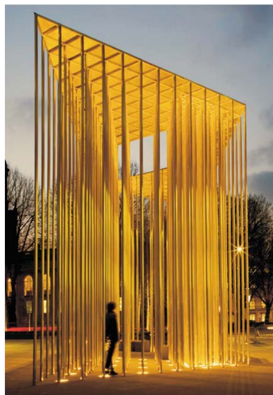
图 1: 处于照亮状态下的 Regent's Place 楼盘装饰亭

对于这种异乎寻常的既高挑又纤长的柱体特性,只能采用一种在一些首要原则基础上发展而来的设计方法来达成,其中涉及了确定项目具体载荷、变形和加速度标准。