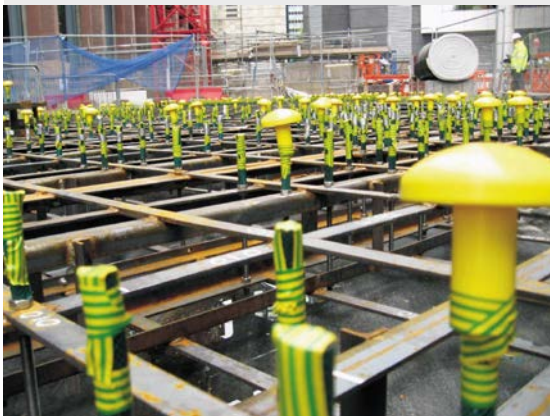
图 6: 混凝土浇筑前的螺栓笼