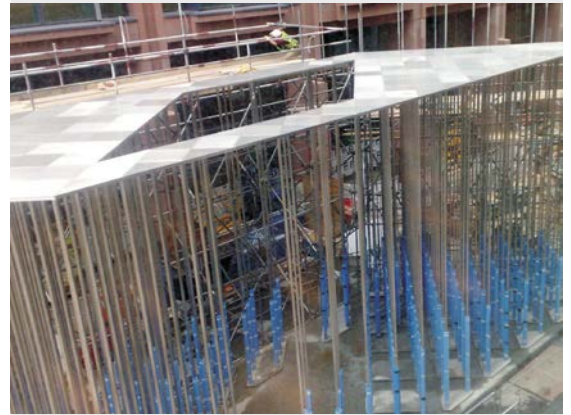
图 8: 正在建造中的装饰亭

沿立柱长度方向施涂了一种胶状塑料保护层以便在运输和建筑过程中保护好立柱[4]。在施工结束后,在远处可以明显看到立柱表面有一些划痕。这时采用了一台抛光机,这台抛光机能够自动沿立柱高度方向上下运行,消除掉所有明显的缺陷。这台专门制造的抛光机获得了“沿排水管爬上爬下的老鼠”的绰号,确保了这些纤长优雅立柱的美丽无瑕。