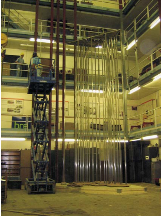
图 5: 在 BRE 建造的装饰亭部件等尺寸模型