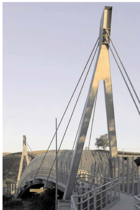
图片 1: 锡耶那人行天桥全貌

这座桥以 60 米长的独跨方式架在高速公路上,设置了 2 米宽的人行道。两条深 500 毫米的纵梁支撑着强化混凝土桥板,纵梁与桥板形成复合作用。在桥跨的每一端各有一个倾斜的倒 Y 形桥塔,桥塔通过刚性棒材拉索支撑起桥跨。在桥跨的四个锚固点有横梁和与拉索相连的悬臂梁。每条主梁均由三块钢板制成(两块凸缘板和一块腹板),薄腹板经横向硬化处理。桥塔为方形管,断面为 400 × 600 毫米。前、后拉索分别为 60 和 70 毫米厚,连在桥塔头部的焊接锚固点上。主梁、横梁和桥塔上所用的结构钢均为经济型双相不锈钢 1.4162。拉索为 1.4462(S2205)双相不锈钢棒材制造(钢种 1.4162 无法提供所要求的棒材尺寸)。步行道用 2.5 米高的丝网板包围住,丝网被支撑在扶手立柱延伸出来的部分。扶手、立柱和丝网都是不锈钢制成的。