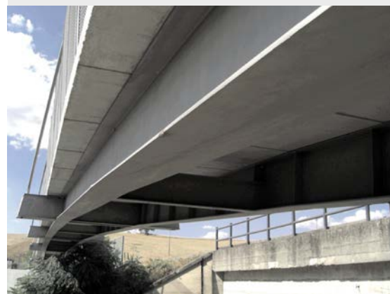
图片 2: 桥梁底部, 露出支撑桥面的纵梁和横梁

热轧双相钢板在瑞典 Degerfors 生产，运至意大利 Solbiate Olona 的一个钢板加工服务中心，然后进行等离子切割和焊接边部准备处理。梁和桥塔先做成大段，然后再运到现场。一对主梁被整体吊装入位并与拉索连接好。预制桥板被安放在主梁上，并在桥板上的凹槽(围绕剪力连接件)浇筑混凝土。这种安装方式使现场建造工作和过程更为简洁，并使建设对环境的影响最小化，二者均使成本减小。