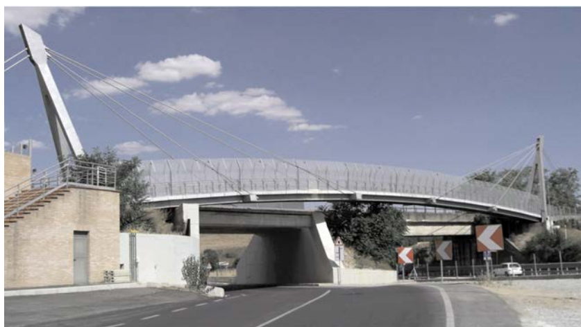
图片 3: 桥梁建成后的公路景观

钢种 1.4162 具有良好的焊接性，可用与焊接其他双相钢相同的焊接工艺对其进行焊接[2]。对电弧能量的限制比传统双相钢更为宽泛些，这是因为这种钢的合金成分较低而氮含量高。