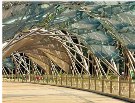
图 3: 穿行于桥上看到的景象,可看到遮挡板

桥梁的设计采用 BS 5950 14 标准并结合了 SCI 15 的设计指南。设计出来的人行桥拥有 2 个螺旋形构造,它们一起作为管状桁架来承受设计载荷。这种设计方法的灵感来源于曲线式的 DNA 结构。这两个螺旋结构只在桥面板下的某一个位置相互接触。用一系列轻量支柱和支杆以及加强环使这两个螺旋形结构保持相互分开,形成一种刚性结构。这种构造方式坚固,对于曲线形的结构很适合。这座不锈钢人行桥两端是混凝土桥墩。