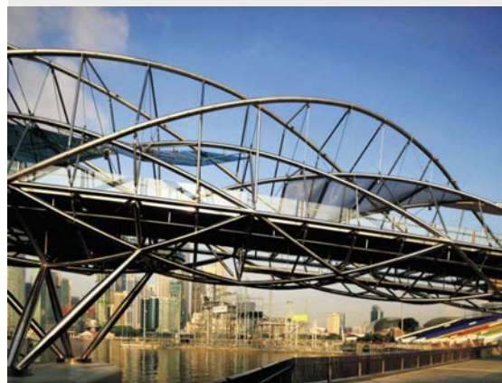
图 4: 两个朝相反方向环绕的螺旋构造的复杂外观