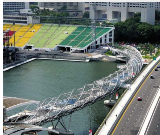
图 8: 竣工后投入使用的步行桥

这些发自欧洲的不锈钢材料包括深度订制的管材和板材，用于满足项目严格的产品和物流要求。安装期间的主要难题是保持一段 50 米宽的水运通道，以及在水运船舶上方保持安全的净空。为了便于这座永久性桥梁的建造，还架设了一条跨越水道的临时性钢结构桥。螺旋人行桥的安装工作从较低的桥板开始，最后完成桥梁最高处的建造。其中包括现场焊接的主螺旋和次螺旋结构的安装，以及轻型支撑杆和拉杆的安装，这些支撑杆和拉杆将两个螺旋构造用销钉固定连接在一起。不同部件之间的连接作业是最大的安装难题，进行经常性的监督和核查是必不可少的。