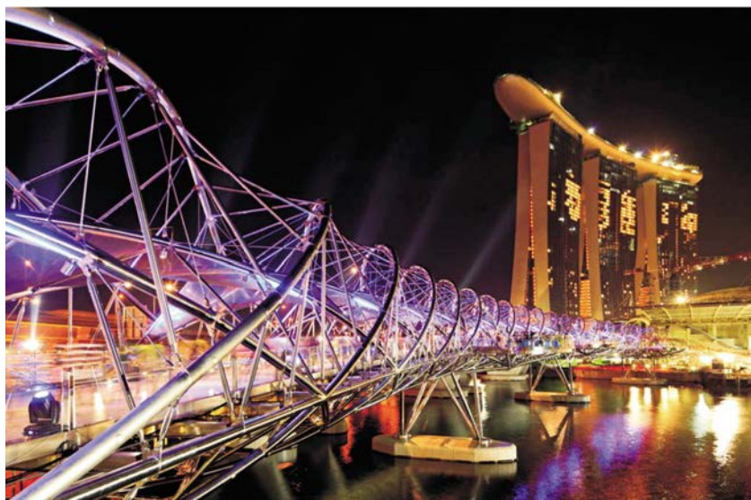
图 1：双螺旋行人桥全景

新加坡的城市人口密集，当地规划部门非常重视高品质的城市设计，鼓励设计师采用可持续、低维护和美观宜人的建筑材料。而这对于处于炎热、潮湿、沿海工业化环境的地区来说，具有较高的挑战性，因为这样的环境对结构和建筑所用的材料都有很高的要求。不锈钢为设计师满足这些要求提供了一个良好的选择，因为不锈钢是耐腐蚀的材料，如果牌号选用得当，则是一种经久耐用的低维护解决方案。