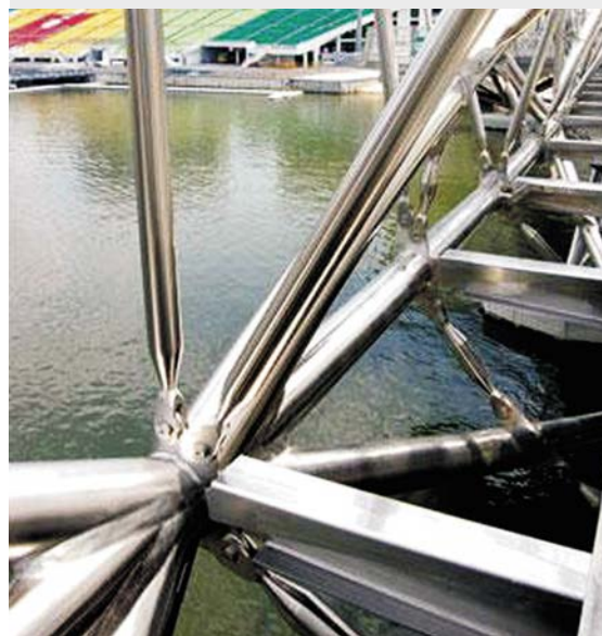
图 5: 连接部分包括焊接和螺栓连接