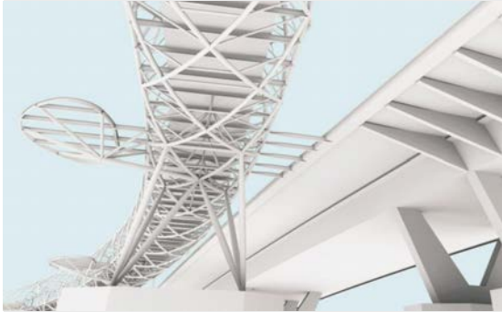
图 6: 人行桥细节示意图

为了考察桥梁结构在失去一个螺旋构造或支撑构架时(由于事故或故意破坏)将发生的变化 [9] ,进行结构整体稳固性的研究也十分重要。